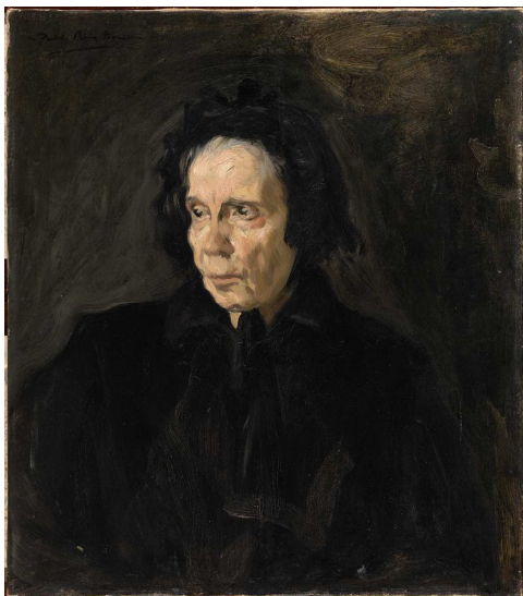
Pablo Picasso (1881-1973) Retrato de la tía Pepa Málaga, junio-julio, de 1896 Óleo sobre tela, 57,5 x 50,5 cm Museo Picasso Barcelona © Sucesión Pablo Picasso, VEGAP, Málaga, 2011